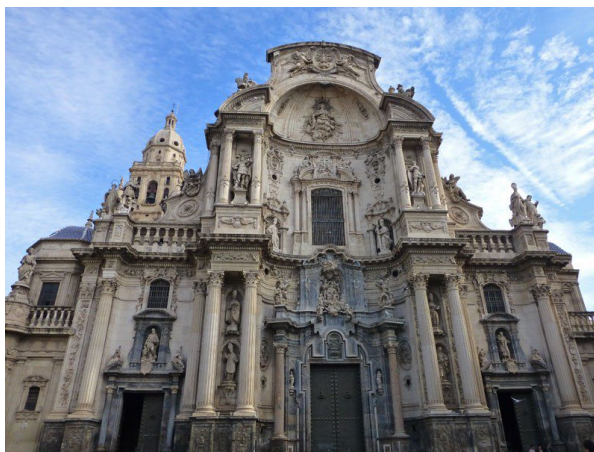
Fachada de la Catedral de Murcia

Otra de las grandes fachadas barrocas españolas es la de Catedral de Murcia, obra de Jaime Bort ('?-1754), que sustituye la fachada original afectada por continuas riadas y movimientos sísmicos en el año 1738 y fue finalizada la obra en 1753.